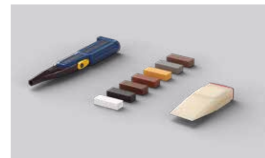
Zestaw naprawczy Pergo PGREPAIR